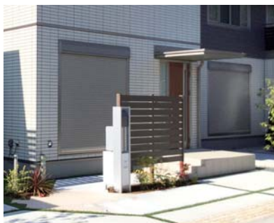
郵便受けと一体化になった宅配ボックス。留守の時でも荷物を受け取れる

■問い合わせ／セキスイハイム東海静岡支社／☎054(237)7107 ジャンボエンチャー下川原店／☎0120(094)800