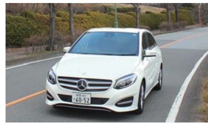
魅力あふれる山梨を快適ドライブ