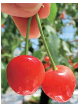
真っ赤に熟れた、食べる宝石キラリ！

旬到来！南アルプス市のさくらんぼは、品種の種類も豊富で、国内ではいち早く収穫期を迎えます。味わえるのはこの期間だけ。南アルプス育ち、新鮮、もぎたて、旬の味をたっぷり堪能してみてください。